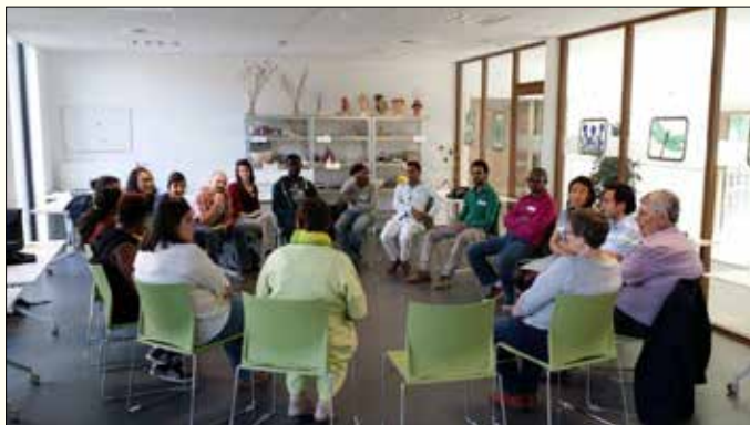
Startmoment Samen Gentenaar

In 2015 lag de focus op de wijk Ledeberg. Hier werden 13 duo's met 12 verschillende nationaliteiten gematcht op basis van hun woon- en leefomgeving. Daarnaast werden ook 24 duo's met 18 verschillende nationaliteiten van buiten deze wijk gematcht.